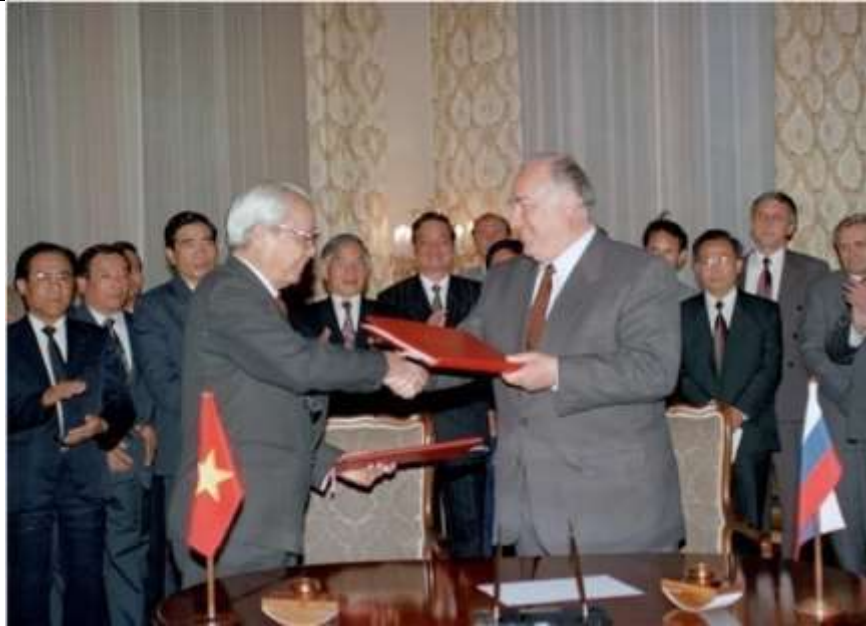
Tratado sobre los principios básicos de las relaciones amistosas entre Vietnam y Rusia

El año 2024, marca el 30º aniversario de la firma del el Tratado sobre los principios básicos de las relaciones amistosas entre ambos países, que sienta las bases legales para las relaciones bilaterales en la era moderna.